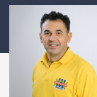
Sebastiano Pititto Atelier de peinture